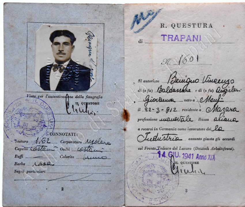
A. Di Miceli

Nel passaporto, oltre ai connotati dell'individuo, viene indicata la "RAZZA ARIANA". Il concetto di "razza", adottato dal regime sulla scia della legislazione tedesca, fu preludio e giustificazione per l'emanazione delle leggi razziali che, ancora oggi, rappresentano una delle pagine più buie della nostra storia.